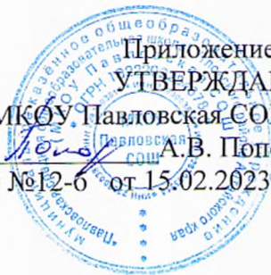
График проведения ВПР – 2023 в МКОУ Павловская СОШ